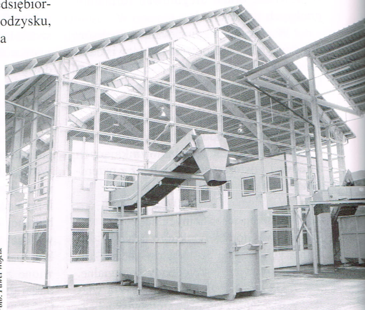
Otwarta w 2007 r. sortownia odpadów komunalnych w Zakładzie Zagospodarowania Odpadów w Ustrzykach Dolnych.

Problem dzikich wysypisk pojawiających się w lasach nadal istnieje, jednak w wielu gminach województwa skuteczna współpraca straży gminnych z mieszkańcami przynosi rezultaty. Istotną rolę odgrywa tutaj edukacja ekologiczna mieszkańców, którzy często informują o przypadkach za-